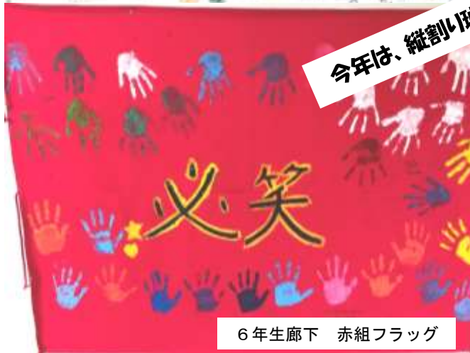
6年生廊下 赤組フラッグ