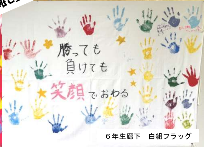
6年生廊下 白組フラッグ

運動会まで、残すところあとわずかとなりました。今年の運動会のスローガンは、「みんなが主役 カラフルスマイル運動会」です。私は、全校練習の際に子どもたちに「運動が得意な人も苦手な人も、それぞれ自分なりのめあてをもって参加して欲しい。皆さんが主役です。応援をがんばる、よっちょれをがんばる、係の仕事をがんばる、リレーをがんばるなど、いろいろ（カラフル）な運動会の参加の仕方がある」と話しました。ご家庭でも、ぜひ、お子さんが運動会でがんばりたいことを聞いてみてください。そして、運動会が終了したらその子なりのがんばりを思いっきり褒めてあげてください。